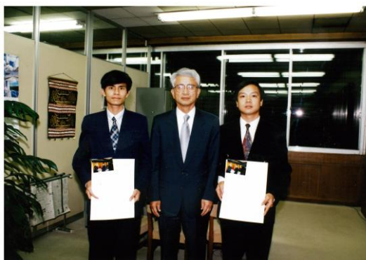
特別講座ベトナム(1996年)